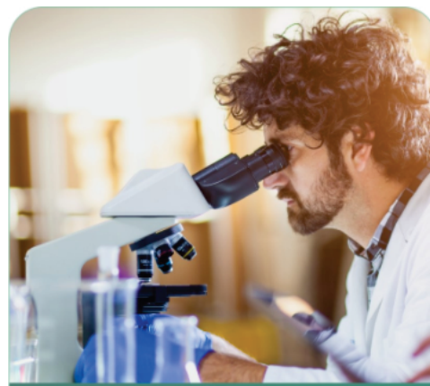
LABORATÓRIO Análises Clínicas