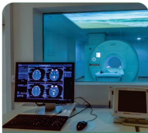
CDI Centro de Diagnóstico por Imagem

Selecione abaixo, o local onde foi realizado o exame que deseja o resultado.